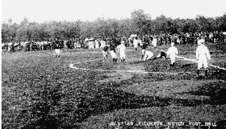
L'any 1909, en el Camp dels Enginyers, es va jugar el primer partit de futbol de la comarca entre l'Esport Club Empordanès, del Casino Sport Figuerenc i el Girona Football Club.

Per les Fires i Festes de la Santa Creu de Figueres, els dies 4 i 5 de maig de l'any 1912 es va celebrar al Camp dels Enginyers de Vilafant el primer festival d'aviació de la comarca, que fou el tercer en la història aèria de Catalunya. El va organitzar el comitè de festes de Figueres i fou presenciat per unes trenta mil persones. Es pot dir que hi havia quasi tota la gent de l'Empordà. L'aviador francès Henri Tixier va concertar el vol amb la comissió de festes de l'Ajuntament de Figueres per la quantitat de tres mil pessetes. L'aeroplà va arribar desmuntat per ferrocarril i calgué traslladar-lo des de l'estació de Figueres fins al Camp dels Enginyers, damunt les espatlles d'uns quants entusiastes. Va fer tres exhibicions, que van costar tres mil pessetes. El motor de l'avió era de 50 cavalls. Les ales estaven recobertes amb tela de fil, i el fusellatge era de fusta sense cap nus. El dia 4 de maig, la gent en corrua, vinguda de tot arreu de la comarca, van anar cap al camp, que es va omplir de gom a gom. La primera prova va consistir en una volta d'uns vint quilòmetres que va durar 13 minuts i 55 segons. Va pujar fins a una altura de 550 metres a una velocitat de 150 km. Fou un esdeveniment extraordinari, una cosa mai vista i que semblava