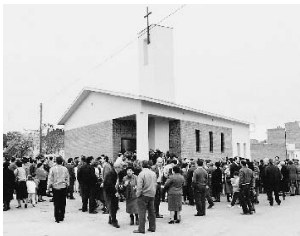
Des del 1988 hi ha una segona església, aquesta dedicada a Santa Maria, que es va construir a la zona de Les Forques.

públiques. Durant la Guerra Civil, l'any 1936, una part de l'església, inclosa la documentació i les imatges, fou cremada pel comitè.