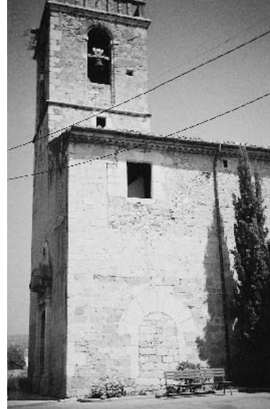
Façana de migdia de l'església de Sant Cebrià de Vilafant. S'aprecien perfectament les tres etapes constructives a partir del primer temple romànic del segle XII.

Fins al 1913, al davant i al costat nord de l'església hi havia el cementiri de la vila. En un llibre del 1889, el capellà va fer constar que al cementiri hi havia dos tipus de nínxols: 23 de particulars, situats sobre la paret del cementiri, i 20 de propietat de l'església emplaçats sobre el terreny. El 1924 es van enderrocar les últimes runes i les restes òssies es van traslladar a una fossa comuna del nou cementiri. Llavors el lloc es va netejar i es decidí convertir-lo en unes placetes