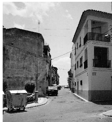
Anteriorment la carretera passava pel mig del poble i es creaven molts problemes de trànsit.

En cas de riudes, els vianants, no podien travessar d'un costat